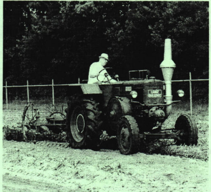
Henk Laarakkers demonstreert de Lanz Bulldog.

Vanaf 1950 breidden de loonwerkzaamheden van Laarakkers sr. zich steeds verder uit. Toen in 1968 de stuw bij Sambeek moest worden vergroot, deed een nieuwe bedrijfsactiviteit haar intrede: het grondverzet.