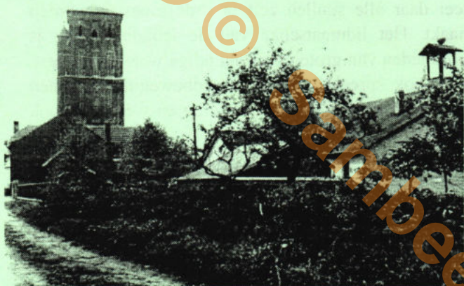
De Schilderstraat eind jaren '50. Opzij van de Noodkerk stond de blokhut. (in het midden van de foto)